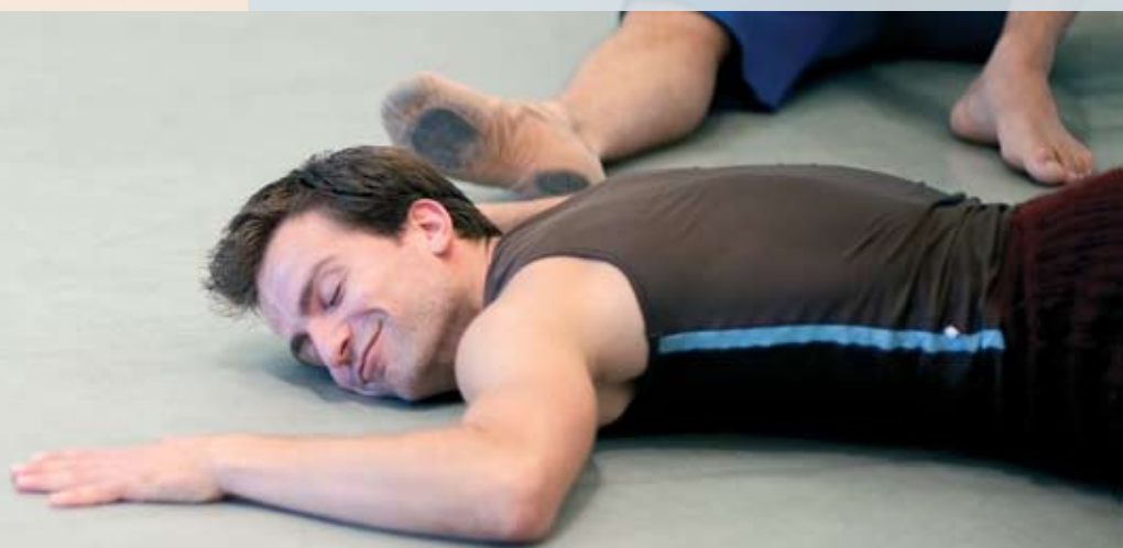
Tapiz Harlequin STUDIO™