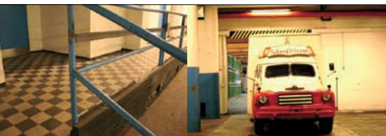
La Dansescenen y la Dansens Hus se instalan en los antiguos locales de la Brasserie Royale Carlsberg

Es precisamente esta relación respetuosa e íntima entre público y arte, la que entraña una identificación espontánea e intensifica la fuerza de la coreografía. Así se establecen los fundamentos de una futura tradición. El ejemplo más significativo según Louise Seibaek es el «succes story» de Tim Rushton, uno de los directores artísticos daneses más conocidos y reconocidos. En la Dansescenen, donde era coreógrafo residente, produjo dos de sus más importantes creaciones, antes de dirigir el Teatro Danés de la Danza, y sobre el tapiz Harlequin DUO™, el primer tapiz de danza de gama Harlequin. Ofrecer a los artistas un medio que fomente la creación en todas sus formas, testimonia una voluntad de crear nuevas formas de expresión, garantía de una tradición futura.